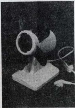
Margaréta asztali szellőző