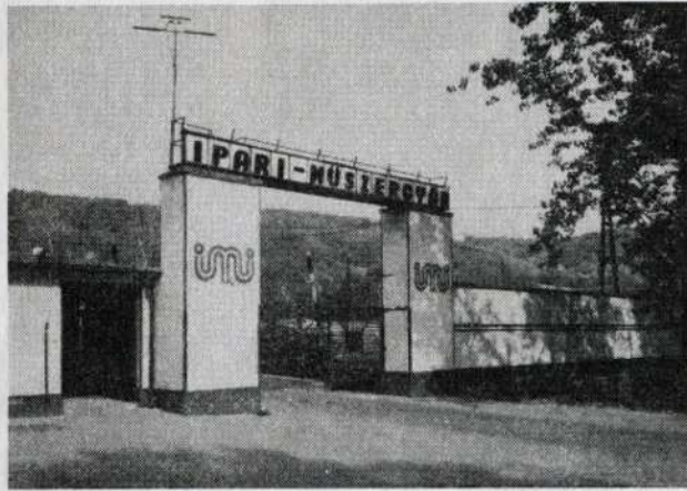
Az Ipari Műszergyár ikladi bejárata