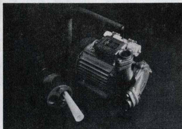
BP 757 típusú szivattyú mélyszívófejjel