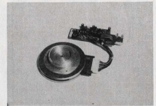
Floppy meghajtómotor elektronikával