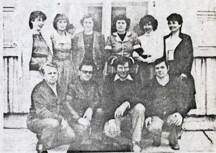
"Kandó Kálmán" szocialista brigád Bercel