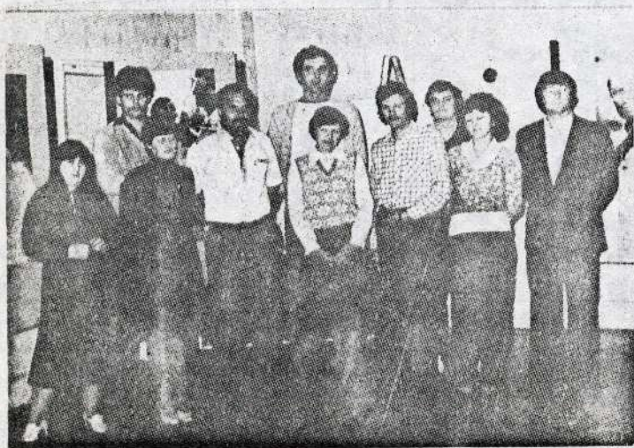
"DH" Ifjúsági szocialista brigád ÜFGY