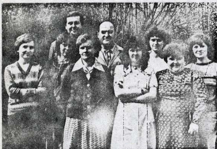
"Várnai Zseni" szocialista brigád Indukciós gyáregység