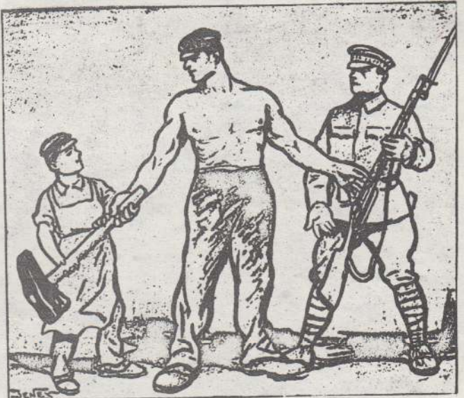
- Használd, fiam, addig, amig visszajövökt!...