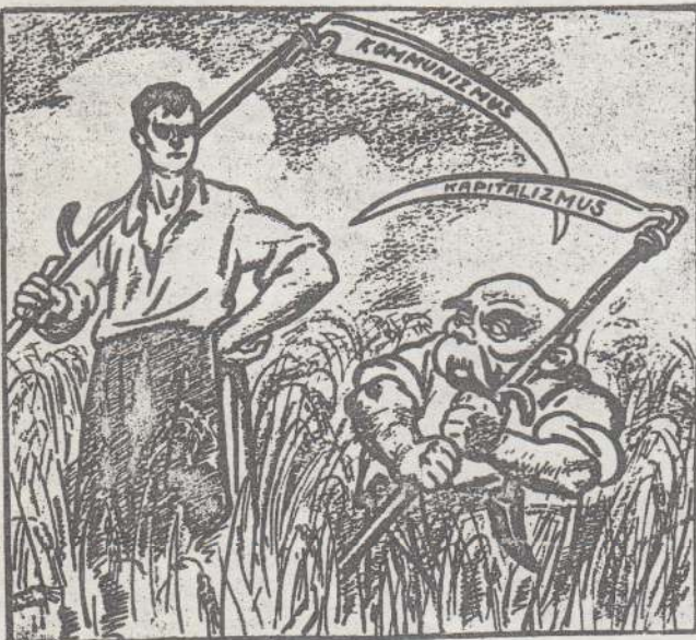
A munkás: Vagyok olyan legendy, mint te! Vágok olyan rendet, mint te!...