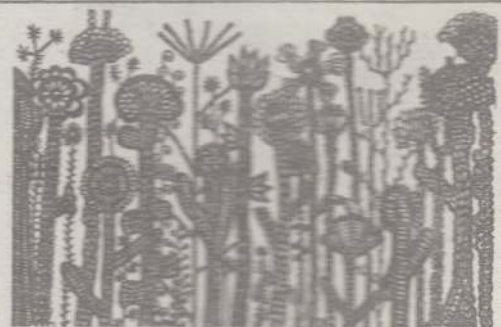
BOHUNKA ISTVÁN RAJZA