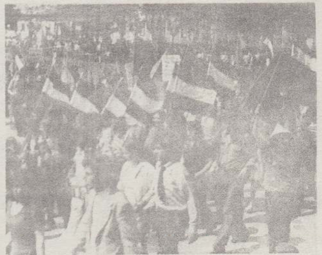
A fiatalok a Dóm-térre vonultak fel; képünkön a ceglédi járás felvonuló csoportja látható.