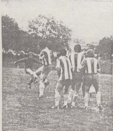
Farkas 20 méteres szabadrúgása védhetetlenül vágódik a monori hálóba