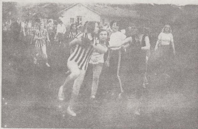
Jelenet a Galgamácsa-Aszód leány-kézilabdamerkőzésről.

Gyűlöltem, óh hogy meggyűlöltem!... És ekkor, zsupsz, egy pillanat: Lóci lerántotta az abroszt s már iszkolt, tudva, hogy kikap. Felugrottam: Te kölyök! - Aztán: No, ne félj, - mondtam csendesen, S magasra emeltem szegénykéit, hogy nagy, hogy óriás legyen.