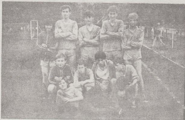
A II. helyezett domonyi labdarúgócsapata