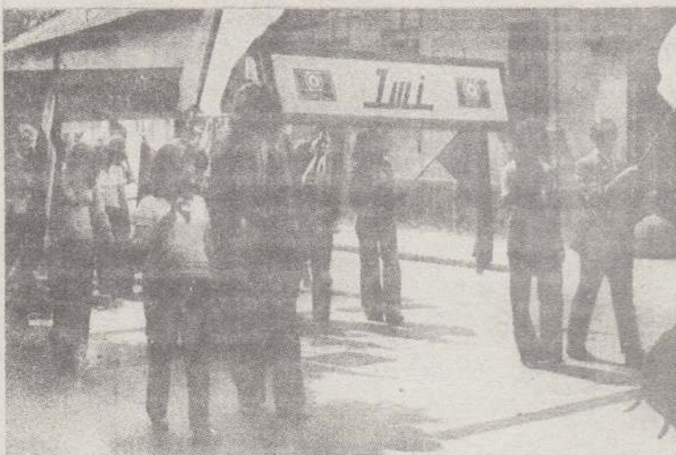
A május 11-i váci ifjúsági nagygyűlésen igen szép látvány volt a felvonuló műszergyári csoport