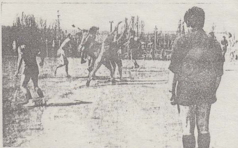
Jelenet az IM Vasas Iklad - MAFC MNK mérkőzésről: Urbán a sortal mellett lő a háttérben