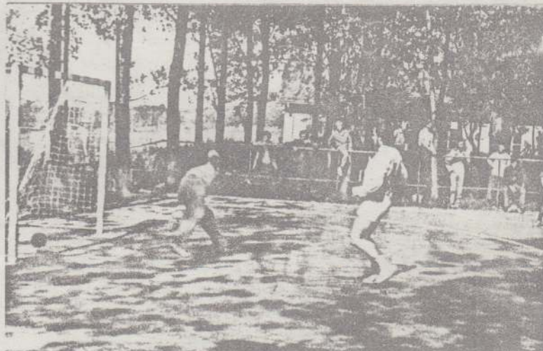
Egy gól a sok közül. Szerzője: Fehér

A bajnokság folyamán többször fordultak elő kirívó eredmények (47:1, 57:11, 45:7) és az is hogy egy-egy csapat nem jelent meg a mérkőzésen, amit éppen a fenti körülmények okoztak.