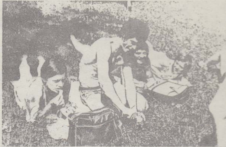
Az utazás és a fürdés után jól esik az ebéd