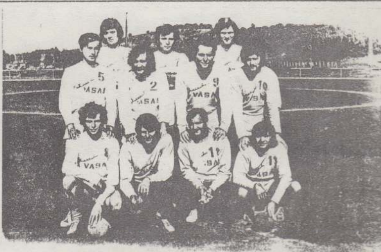
A bajnok kézilabda-csapat