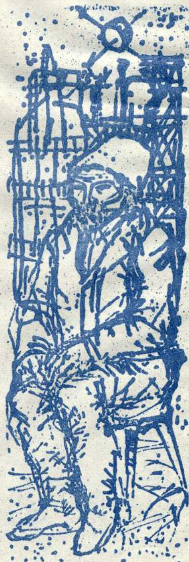
Kondor Lajos rajza

Újól, most már ebben a vonatkozásban felvetettük a lehető-