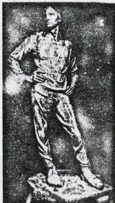
Constantin Meunier (1831-1905): Rakodó munkás.