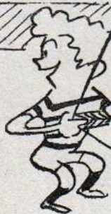
— ÉS AKKOR JÖT A ROBIN HOOD....