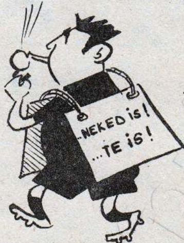
...AKI FELKÉSZÜLT A SZÍDALMAKRA...