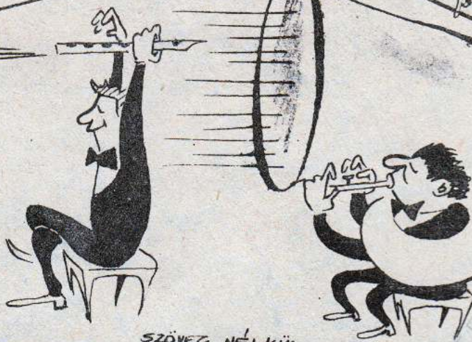
SZÖVEG NÉLKÜL. ELŐRELÁTO FÁTEKVEZETŐ...