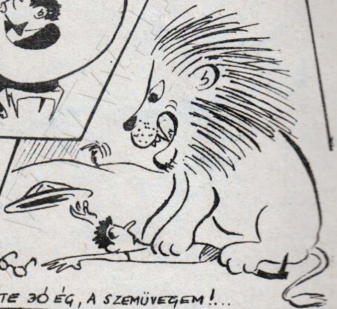
Ő IS LÁTTA...